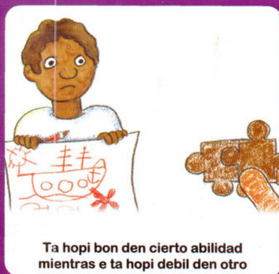
Ta hopi bon den cierto habilidad mientras e ta hopi debil den otro